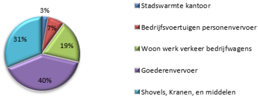
Figuur 2 – Overzicht verdeling emissies scope 1