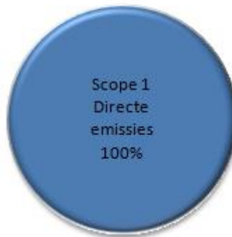
Figuur 1 – Overzicht emissies scope 1 + 2 over 2021 (scope 2 = nul)